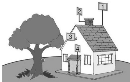
Рисунок 1 – Варианты установки антенны

3.2. На пути от антенны до базовой станции не должно быть никаких близко стоящих высоких препятствий (здания, горы, холмы, лесопосадки и т.п.) мешающих распространению сигнала. Поэтому устанавливайте антенну как можно выше.